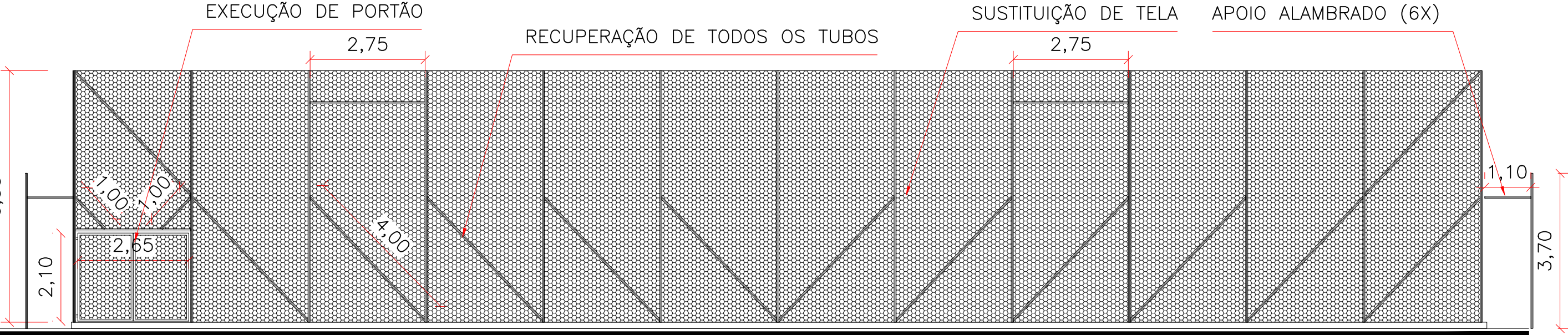
VISTA LATERAIS ESCALA/1:100